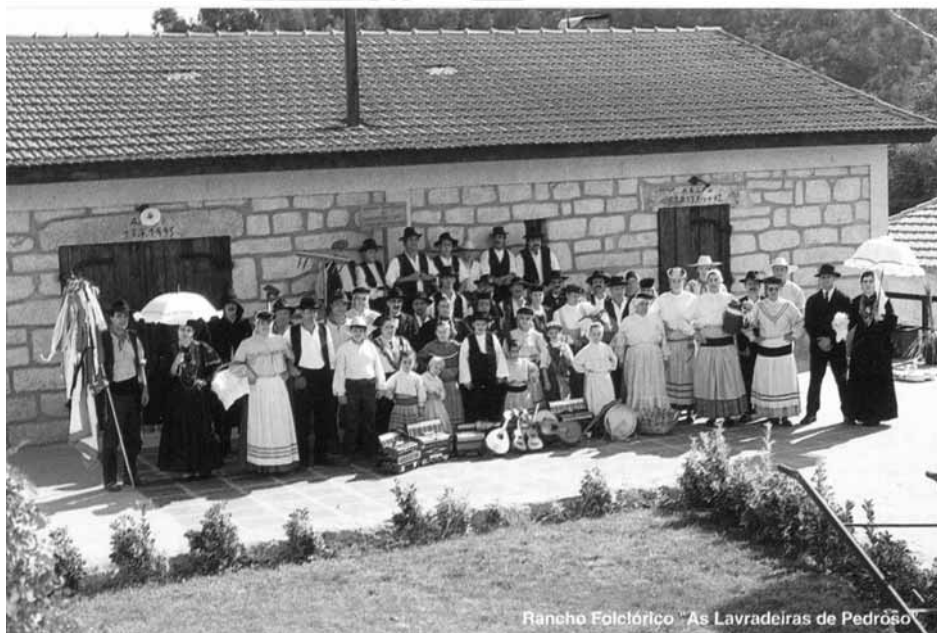
Rancho Folklórico "As Lavradeiras de Pedroso"

Han participado en varios festivales nacionales, Romerías por todo el país, siendo dignas de destacar sus actuaciones en Cuevas del Vino de Oporto, para delegaciones turísticas extranjeras, que visitaron Portugal.